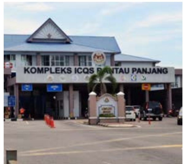
Kompleks Imigresen, Kastam, Kuarantin dan Keselamatan (ICQS) Rantau Panjang merupakan salah satu pintu masuk sempadan antarabangsa Malaysia – Thailand.