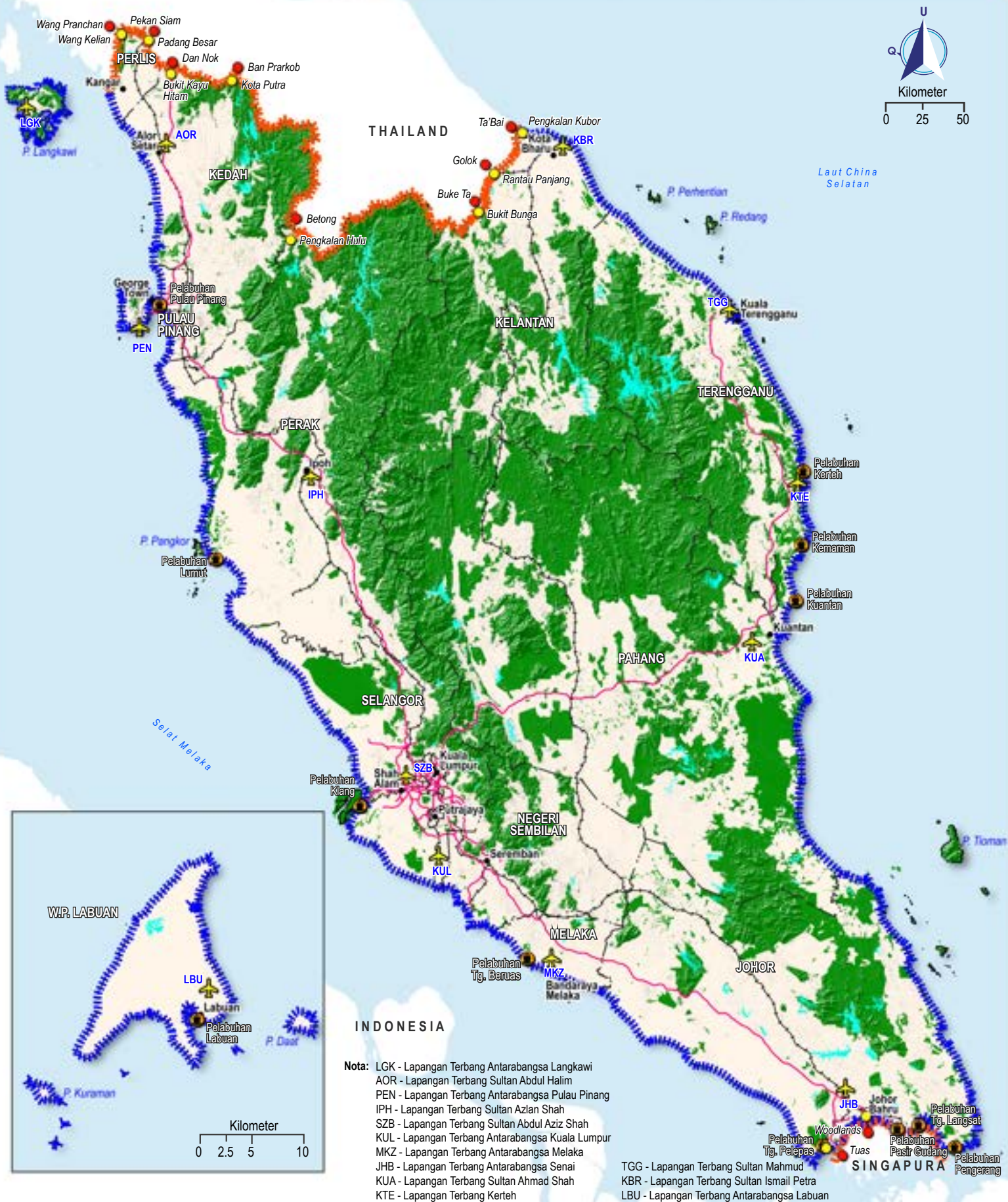
PELAN 4-3: SEMPADAN PINTU MASUK NEGARA SEMENANJUNG MALAYSIA DAN W.P. LABUAN